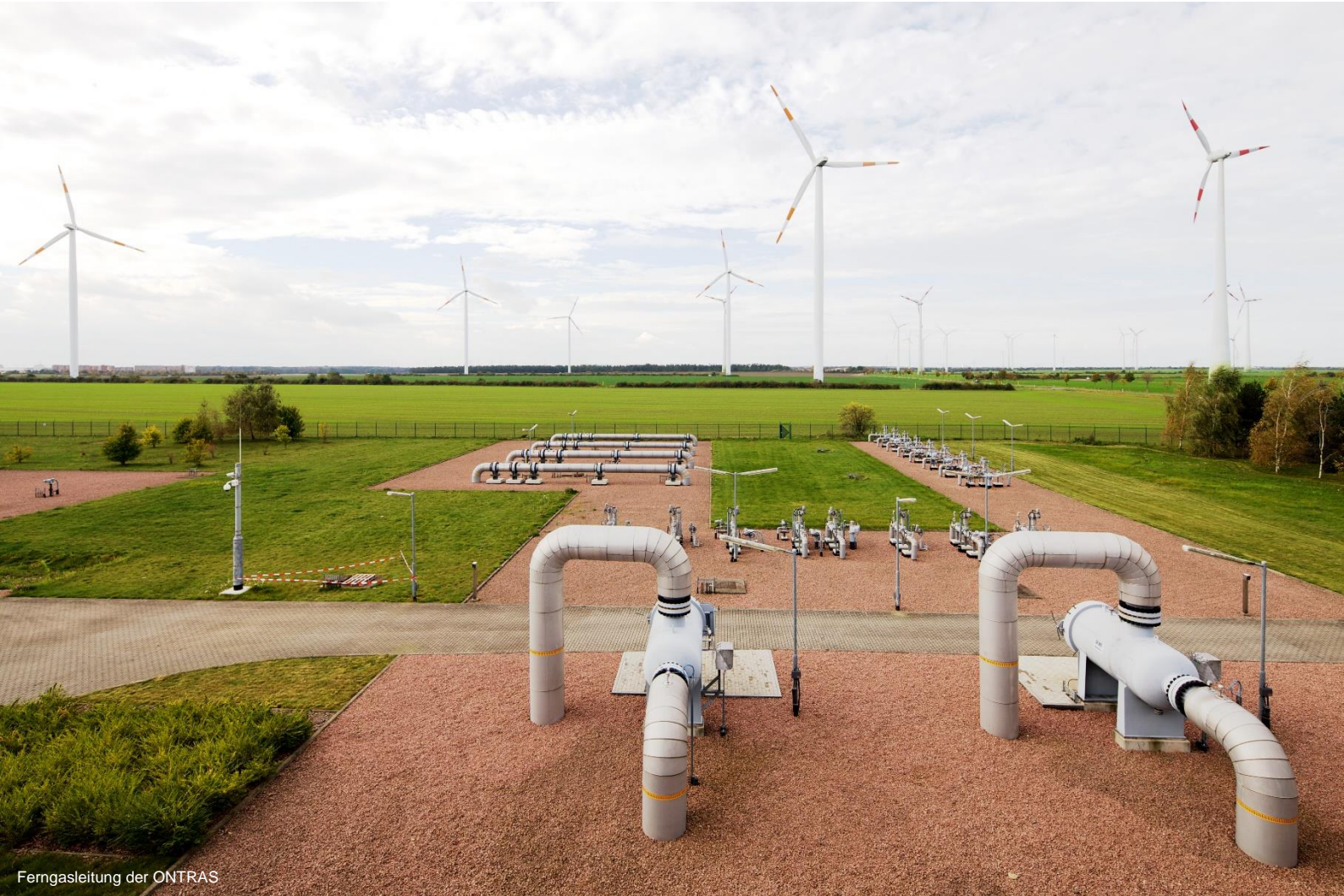
Ferngasleitung der ONTRAS